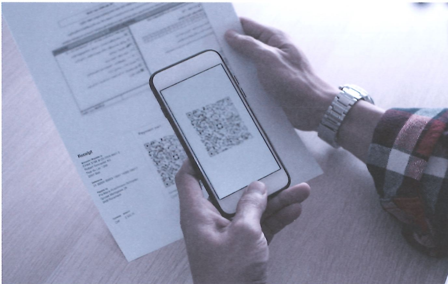
Scannen und fertig: Der QR-Code enthält alle relevanten Rechnungsdaten.

Lesen Sie mehr zum Thema im Blogbeitrag von TREUHAND|SUISSE unter www.treuhandsuisse.ch/blog