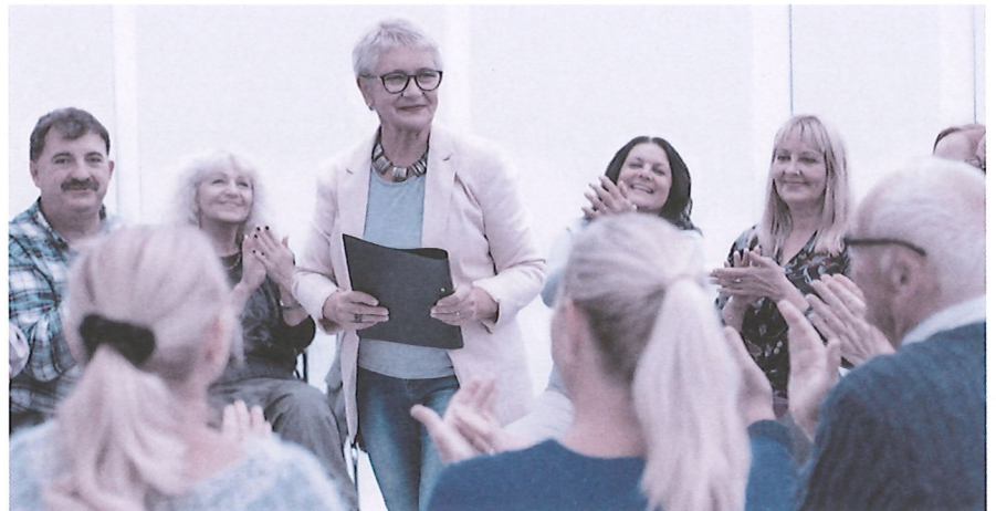
Wer sich bewusst mit seiner Pensionierung befasst, tut sich leichter beim Übergang in den neuen Lebensabschnitt.

Die Pensionskasse lässt mehr Optionen offen. Viele Pensionskassen bieten ihren Versicherten die Möglichkeit, das gesamte Vorsorgeguthaben in Kapitalform zu beziehen. Dabei ist eine minimale Auszah-