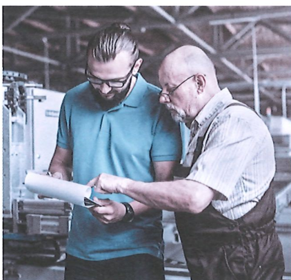
Nicht jeder will mit 65 schon aufhören. Das dient auch dem Unternehmen.

Ist im Arbeitsvertrag, im Personal- oder im Betriebsreglement nichts zum Ausstieg bei der Pensionierung festgehalten, muss das Unternehmen nach Rücksprache mit dem Arbeitnehmer den Arbeitsvertrag kündigen: auf das Ende des Monats, in dem der Mitarbeitende das ordentliche Rentenalter erreicht. Dabei sind die geltenden Kündigungsfristen einzuhalten. Bei Krankheit oder Unfall gelten die gesetzlichen Sperrfristen und die Vorschriften zur Lohnfortzahlung.