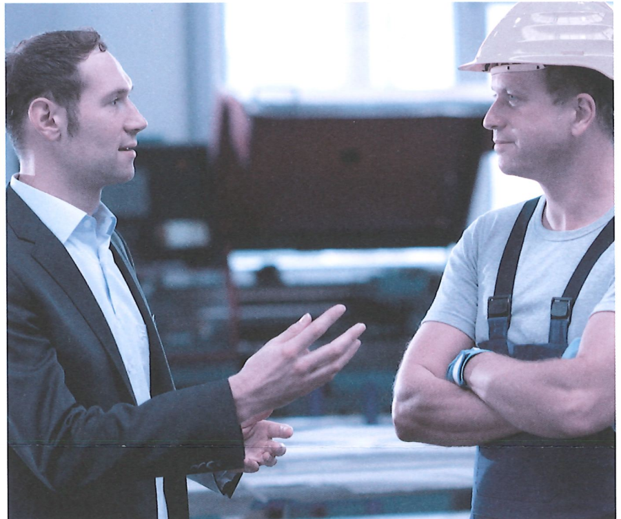
Das Mitarbeitergespräch ist keine Nebensache. Nehmen Sie sich Zeit und hören Sie zu.

Die ausschliessliche Konzentration auf objektiv messbare Ziele wird den Qualitäten und Bedürfnissen des einzelnen Mitarbeitenden nicht unbedingt gerecht. Zunehmend wichtiger sind sogenannte agile Ansätze. Sie lenken den Blick zum Beispiel auf Werte wie eigenständiges Arbeiten und funktionsübergreifende Zusammenarbeit. Dies kommt auch den heutigen Erwartungen der Mitarbeitenden entgegen, die flachere Hierarchien und mehr Eigenverantwortung bevorzugen. Grundlage für einen solchen Ansatz bilden das Vertrauen in die Mitarbeitenden und ein Führungsverständnis, das auf Coaching des einzelnen Mitarbeitenden setzt. Gestalten Sie das Mitarbeitergespräch als Dialog auf Augenhöhe und nutzen Sie es, um die Stärken, Wünsche und Ziele Ihrer Mitarbeitenden kennenzulernen und darauf weiter aufzubauen – also die «Stärken zu stärken». Agile Führung bedeutet auch, dass Sie Aufgaben an die Mitarbeitenden abgeben und gemeinsam mit ihnen die besten Lösungen für Herausforderungen finden. Lassen Sie diese Aspekte in die Leistungsziele einfließen.