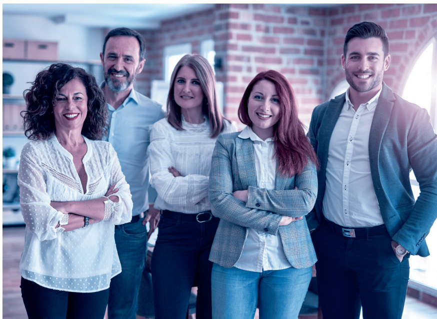
Alles klar: Das Personalreglement schafft eine verbindliche Regelung der Arbeitsbeziehung.

Grundlegender Bestandteil des Personalreglements ist das Arbeitszeitmodell des Unternehmens. Also beispielsweise die gleitende Arbeitszeit mit definierten Blockzeiten, Regelungen zum Homeoffice und die im Betrieb übliche Wochenar-